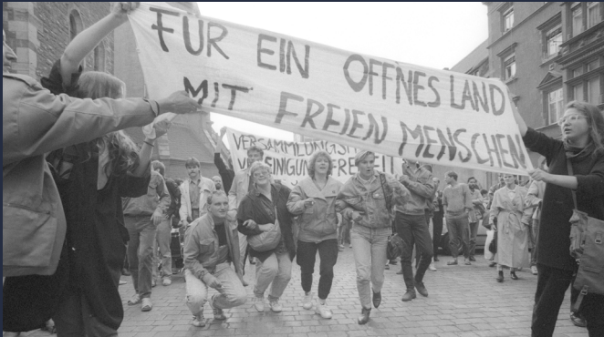
Friedliche Revolution 1989