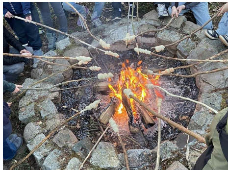
Stockbrot am Lagerfeuer