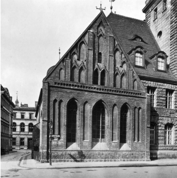
Heiligegeistkapelle, Berlin 1910

Vortragsabend des Diözesangeschichtsvereins am 6. Mai